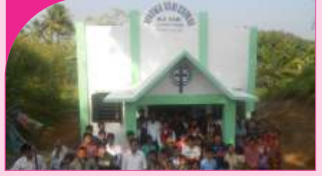
Magraisardar Kami, Tripura - 15.12.13