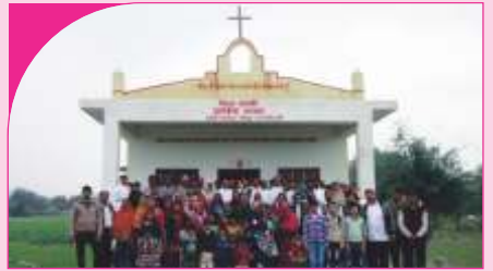
Tiwaripur, Uttar Pradesh