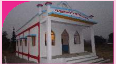
Joghava, Gujarat - 15.01.14