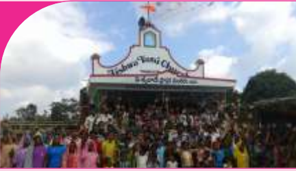
Thankidi, A.P. - 22.12.13