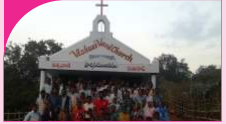
Sandhiguda, A.P. - 22.12.13