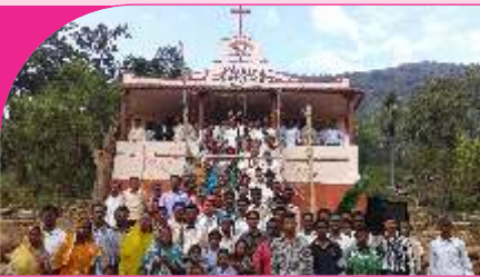
Mulaguda, A.P. - 05.01.14