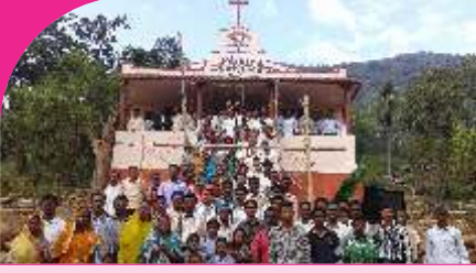
Vodakoyya, A.P. - 11.12.13