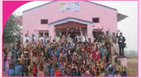
Motiya, Rajasthan - 26.12.13