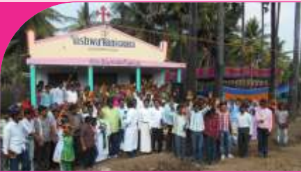
Gajulagondi, A.P. - 29.12.13