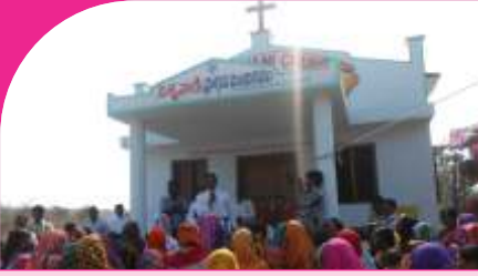
Kumari, A.P. - 22.12.13